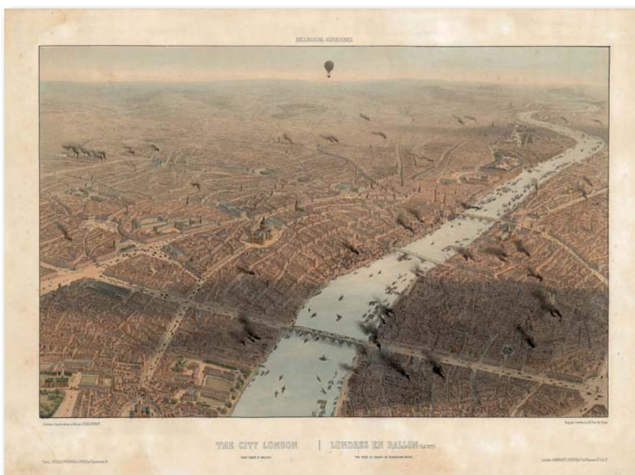
Londres a mitjan segle XIX. Dibuix de Jules Arnout de la City de Londres des d'un globus sobre el pont de Blackfriars.

«Aquesta realitat atorga molt més valor a la seva proposta de creació del Nou Eixample de Barcelona en el qual Cerdà deixà ben clar que tots els carrers havien d'anar acompanyats de plantacions o alineacions d'arbres.»