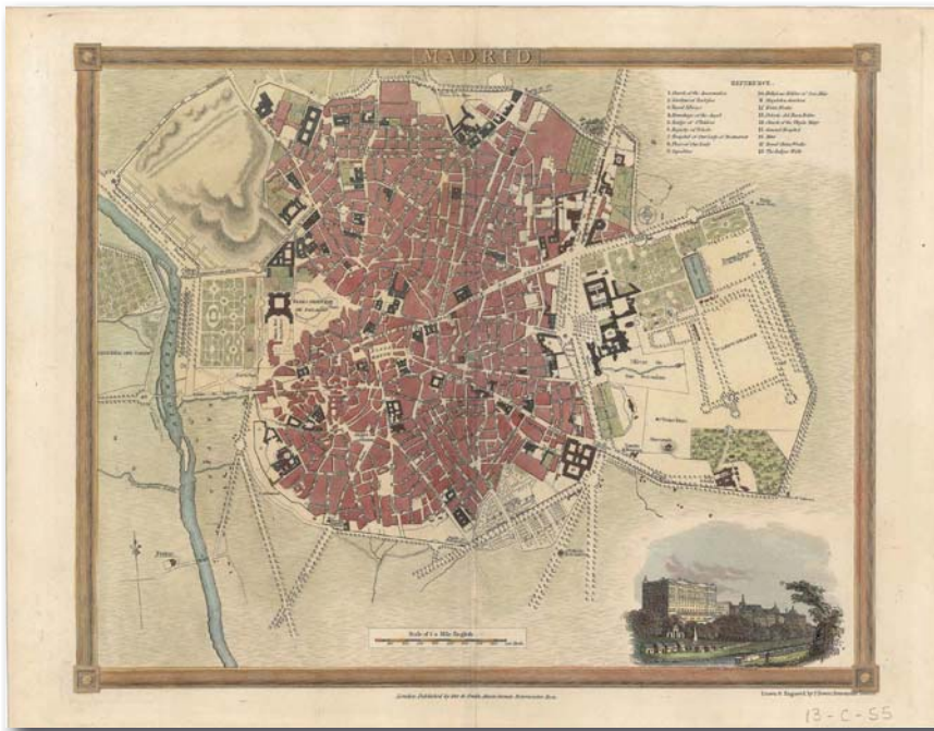
Nucli urbà i històric de la ciutat de Madrid i els seus voltants a mitjan segle XIX. Dibuixat per John Crane Downen, ens mostra una ciutat molt densa que no té cap carrer arbrat dins el nucli urbà. Font: Instituto Geográfico Nacional – Cartoteca.

«Arreu, els arbres anaven lligats, majoritàriament, als passeigs, els jardins, els parcs o les carreteres. En canvi, la presència d'arbres als carrers era quasi nul·la.»