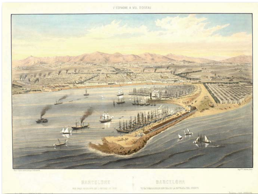
Barcelona a mitjan segle XIX. Vista des de l'entrada del port d'Alfred Guesdon, 1856.

«En aquests primers anys en què Ildefons Cerdà va viure a Barcelona va trobar-se una ciutat on els únics arbres situats entre edificacions eren els de la Rambla, ja que la resta eren passeigs o camins arbrats.»