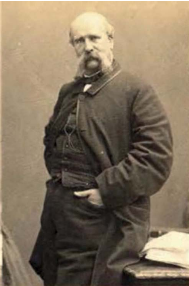
Ildefons Cerdà en una foto feta a París.

«Cerdà visqué una infantesa i adolescència en un medi rural molt actiu, productiu i avançat.»