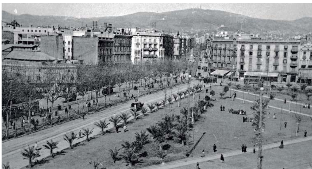
Plaça de Catalunya, cantó Rambla de Catalunya, any 1906.